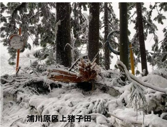
浦川原区上猪子田

※各地の被害状況写真は私のホームページ、フェイスブックに載せていますのでごらんください。