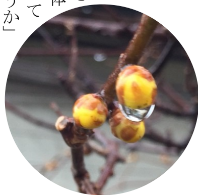
【ロウバイ】ロウバイ科の落葉低木。漢字で「蠟梅」と書きます。急に、手書きで名前を書けと言われれば、狼狽してしまいますね。花言葉は「慈しみ」「愛情」「先見」など。写真は柿崎区馬正面にて撮影。

議会モニター制度は新年度から実施される見通しとなりました。この日の会議において、全会一致で市議会の予算に計上していくこと