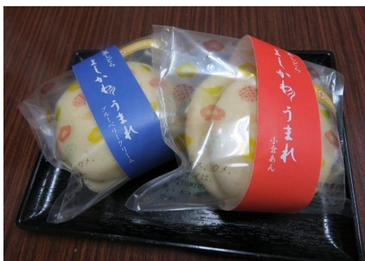
山芋の味がほんのり。吉川商工会女性部特産品プロジェクトチームが開発した、白い蒸しどら、「よしかわうまれ」が人気です。お求めは吉川区の小浜屋へ。