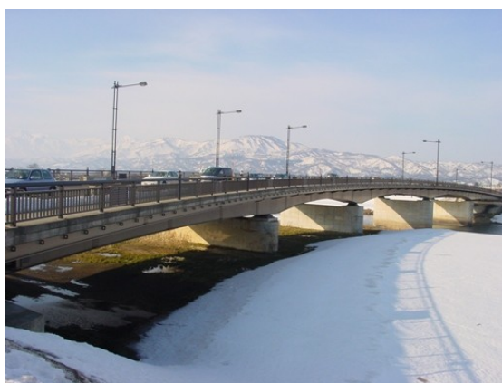
シリーズ 上越市内の橋 第28回 中央橋

「中央橋」と書いて「ちゅうおうばし」と読みます。関川にかかった橋で、主要地方道高田停車場線上にあります。橋と