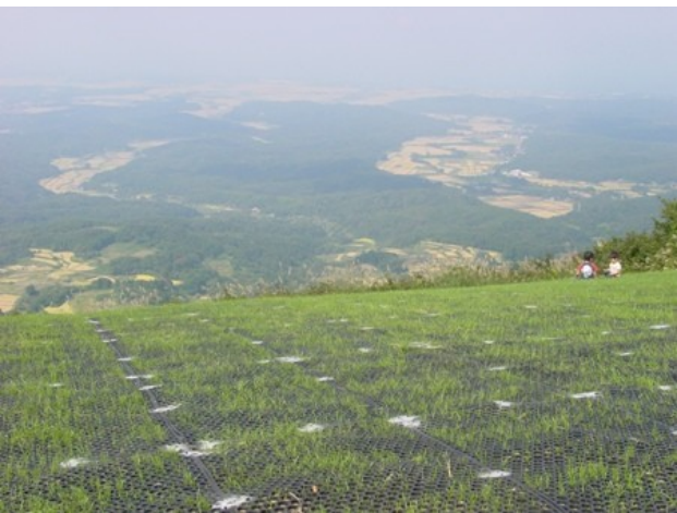
国体を前にパラグライダー離陸場もきれいに整備されました。あとは競技の当日、晴れてほしいですね。

同議員は、まず平成20年度について、「自公政権による大企業優先、国民生活破壊の悪政がますます強められた結果、貧困と格差が急速に広がった。社会を覆う貧困の広がり、根底には人間らしい雇用のルールの破壊がある。社会