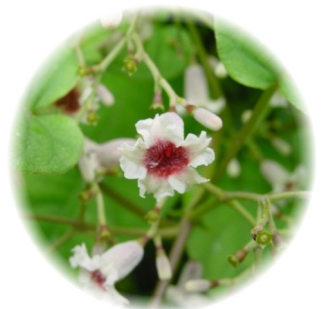
【ヘクソカズラ】漢字で書くと屁糞葛となります。ちょっと気になる臭いを放つだけで、とんでもない名前をつけられてしまったものです。

聴いて案をまとめることも大事だけれども、条例の制定過程を伝え、意見や注文をもらえるようにする工夫が必要ということです。今後、市議会のホームページなどでの掲載を求めています。もちろん、市政レポートや私のホームページでもお伝えしていきます。