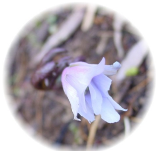
何と春咲くキクザキイチゲがもう咲いていました。異変です。（13日、東鳥越にて撮影）

私たちはこれまで、株よしかわ杜氏の郷をできたら残したい。しかし、その場合、①市、JA、会社の役割と責任が明確になっているかどうか、②今後の経営改善計画が現実的で実現可能なものになるかどうか、③経営改善計画をしっかりととらえる新経営陣が登場するかどうか、④（3者合意などを）吉川区住民に十分説明し、ぜひこれでやってほしいという意思確認がされるかどうか、が判断のモノサシになると繰り返しのべてきました。今回のような状況の中で、市議会が結論を出したことは残念に思います。