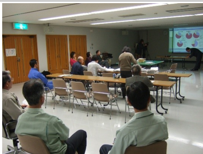
右の写真はアンケート開封・集計作業の様子です。15日、撮影。

このアンケートは吉川区内の全世帯(1551)を対象にして日本共産党議員団が実施したもので、608通(回答数607)が返ってきました(回収率39.2%)。開封・集計作業は公開の中で実施しました。