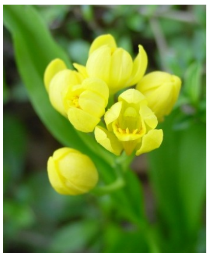
【キンラン】かつてはいろんな場所で見られた黄色のラン。最近では少なくなっていました。写真は平場の山林で咲いているものです。杉と雑木の、ちょっぴり薄暗いなかで輝いていました。