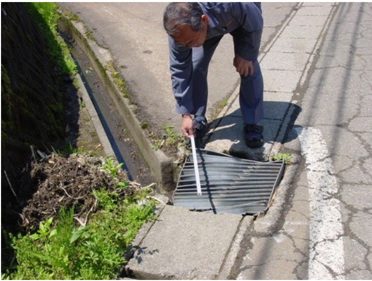
【写真上】こわれた側溝のふた（源地区）。これは直ちに総合事務所に連絡。同事務所からは即日対応したと報告がありました。【写真右】陥没したままの路面（下中条地内）【写真下】陥没し、ひび割れもしている路面（福平地内）写真はいずれも14日午前撮影。