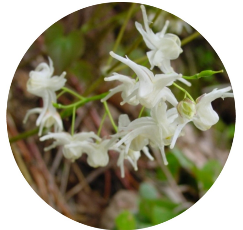
【トキワイカリソウ】いま区内のあちこちで咲いています。船の錨に似た花をつけることからこの名前がついたものですが、それにしても個性あふれた花です。

自分の子どもが亡くなったのでお母さんの保険に入れたらいい。年金から引かれるのはお母さんから引かれるのは切ない。なんともしてくんない。