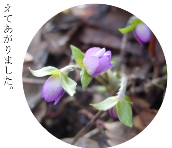
【雪割草】この雪割草はわが家の庭に咲いているものです。雪消えを待って、すぐに咲く小さな紫色の花は可憐そのものです。わが家にはピンクと白の花をつける雪割草もあり、元気に育っています。

上越市は昨年9月、行政改革推進計画に基づいて公の施設の統廃合方針を決め、市内にある998の施設のうち、耐用年数経過後10年以上経過しているものなどを抽出し、個々の施設ごとにどうするか検討を進めてきました。今後、市民の声を聞き、地域協議会などへの諮問を経たのち、今年9月頃には正式決定の予定と見られます。