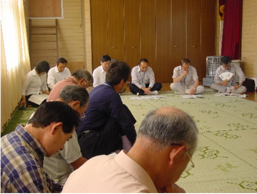
写真は東田中会場の様子。3日撮影。