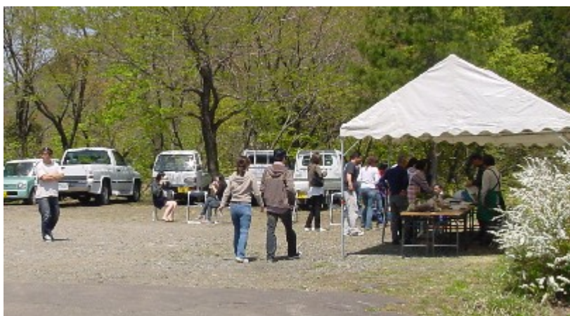
（写真は山菜まつりの様子。30日撮影）

かったこともあって、ウドはすでに終わりに近づいていきましたが、スタッフの皆さんは、この日のために遅くなってもいいウドを確保してお客さんへのサービスにとめていました。ウドの粕汁の無料サービスもありました。