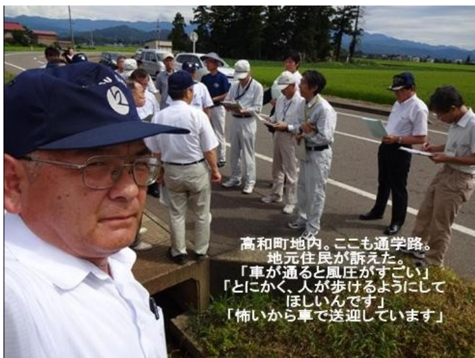
8月4日の現地調査の様子

高和町地内。ここも通学路。地元住民が訴えた。「車が通ると風圧がすごい」「とにかく、人が歩けるようにしてほしいんです」「怖いから車で送迎しています」