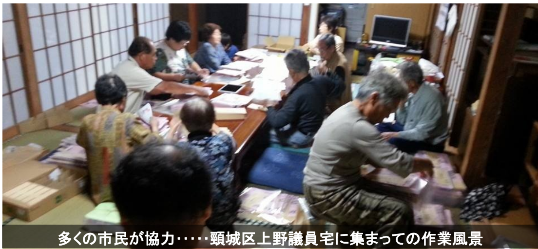
多くの市民が協力……頸城区上野議員宅に集まったの作業風景