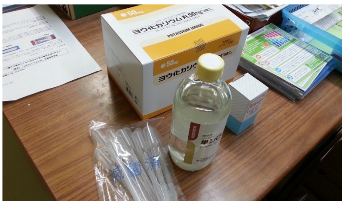
休日医療センターに保管されている安定ヨウ素剤

北陸新幹線の上越妙高駅や、信越線の脇野田駅の工事整備状況なども、担当課の説明を受けながら、現地を確認しました。このように、日本共産党議員団は、現場調査に基づいた