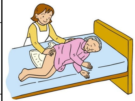
紙おむつ助成を縮小

そうした中で、市民の暮らしを最前線で守るべき市政では、将来のこともさることながら、目前の暮らしをどう支えるかが問われています。大型事業への「投資」よりも、市民の負担を軽減し、日常生活に密着したサービスを充実させることが、より大切です。